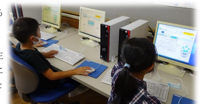
3年算数：学習支援「eライブラリ」を取り入れた授業

今、目の前にいる子どもたちが社会で活躍する20年後、30年後は、「これが正解！」という答えが一つとは限らない時代といわれています。コロナ対策もそうですが、様々な情報をもとに正しい知識を身につけ、みんなで『みんなが笑顔になる世の中』をつくっていくことが大切であると感じます。